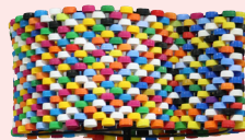
Lisa Colombe Adjobi Luminaire Ehuadé (La Vie) 2022, métal et bouchons de bouteilles en plastique, 170 x 60 x 33 cm, éd. limitée en petite série. Créations en vente en direct via Instagram @lisa_colombe_adjobi > 1700 €