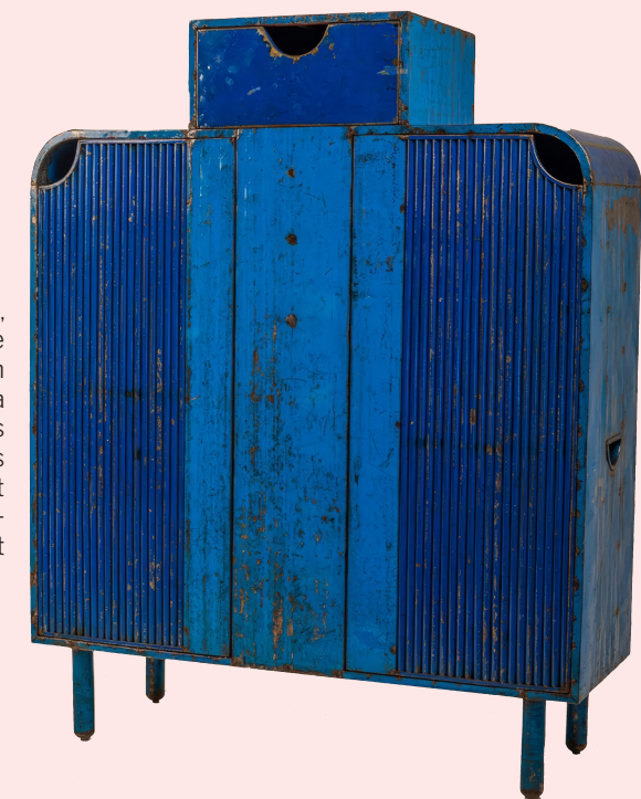
Meuble Dougou, série Bolibana 2022, barils d'huile recyclés, 140 x 45 x 111 cm, pièce unique.

> À partir de 800 € pour un tabouret en édition ouverte > Jusqu'à 40 000 € pour un cabinet unique