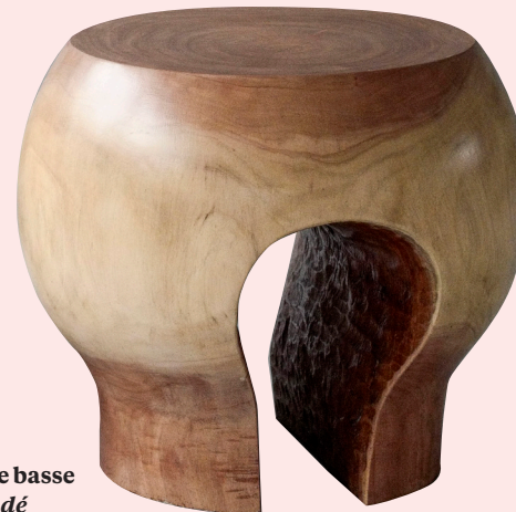
Table basse Sokodé 2023, acajou de Ceylan, h. 40 cm, diam. 40 cm, édition de 8 ex.

Inspirés à la fois par les traditions africaines et par les arts décoratifs européens, ces trois créateurs proposent des meubles de caractère à l'esthétique singulière.