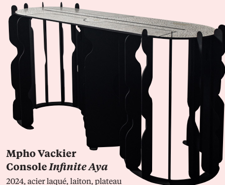
Mpho Vackier Console Infinite Aya 2024, acier laqué, laiton, plateau en coquilles d'œufs d'autruche et époxy, 160 x 60 x 82 cm, éd. limitée à 10 ex. Créations en vente en direct sur theurbanative.com > 6 500 €