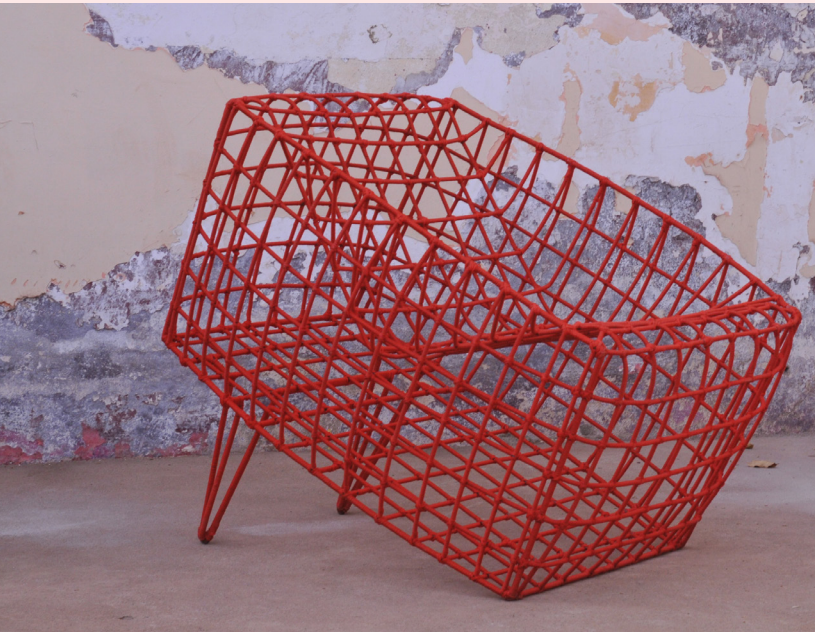
Cheick Diallo Fauteuil Sansa (rouge) 2010, fil métallique et nylon. 80 x 90 x 90 cm, éd. limitée à 24 ex. Dans les collections du MAD (Paris), du Brooklyn Museum (New York), du Macs Grand-Hornu (Belgique), du Vitra Design Museum (Weil am Rhein, Allemagne), du musée Mandet (Riom, France). Représenté par Southern Guild (Le Cap-Los Angeles) et 50 Golborne Gallery (Londres) > 6 000 €

Original et innovant, écoresponsable et durable, ancré sur le continent : autant de qualités attribuées au design des créateurs africains, loués aux quatre coins de la planète.