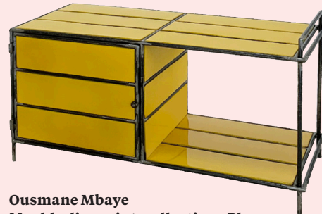
Ousmane Mbaye Meuble d'appoint, collection «Plus» 2022, tubes et plaques en acier galvanisé, peinture et vernis haute densité, 45 x 85 x 40 cm, éd. ouverte. Créations en vente en direct via Instagram @ousmanembaye_design > 760 €